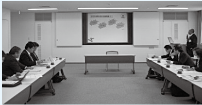
▲岩倉市議会にて質疑応答

流山市は、自治基本条例を先進的に策定されています。特徴としては、「自分たちのまちの課題は、自分たちで解決する」ことを基本理念とし、市民が市民の中に入って、市民意見を集める方式をとって、市民みずからゼロから条例を作りあげていったとのことでした。