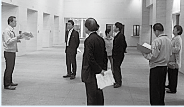
▲延岡市新火葬場を見学

日向市では、高齢化が進む商店街の活性化をめざし、まちなかでのイベントを通してPRを精力的に行うなど、「人が集い、ふれあい、暮らす」をキャッチフレーズに、空き店舗を活用したまちづくりを進めているとのことでした。