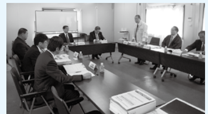
▲大槌町（仮設役場にて）

また、大槌町では、「災害復旧におけるまちづくり」として、津波の災害リスクと向き合い、防災教育の推進や防災体制の強化をするなど、今回の災害を契機に、新たな気持ちで、新しい大槌町の再生、復興に取り組んでいくために、町民の総力をあげて「美しいまち」大槌を目指しているとのことでした。