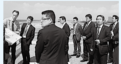
▲関西国際空港2期島 LCCターミナルビル工事現場

また、観光についても、行政と市民と観光協会の協働による取り組みが展開されており、「じゃらんリサーチセンター」によるアンケート調査では、「おもてなし満足度」で、全国No.1を獲得したそうです。