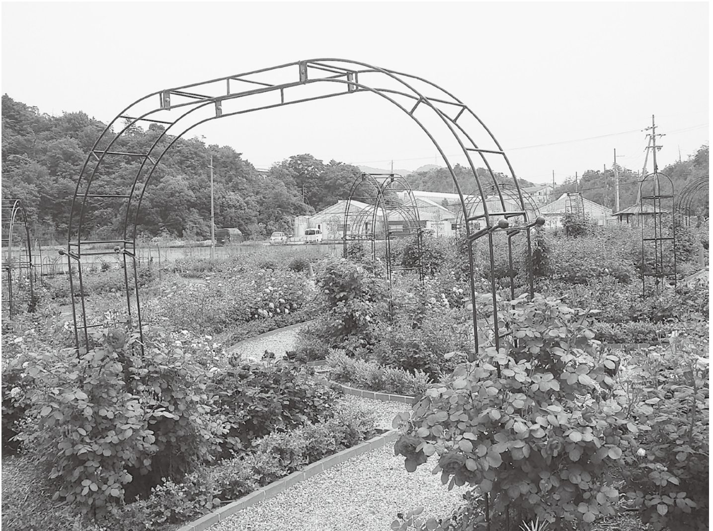
▲花咲きファーム イングリッシュローズガーデン