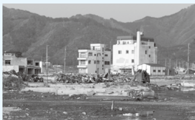
▲大槌町内（津波被害状況）

遠野市では、中心市街地活性化計画を策定し、ソフト事業を商工会が、ハード事業を行政で担うという役割分担をしながらまちなかに賑わいを再生する計画を進めていました。