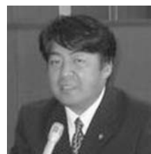
竹田 光良 たけだ みつよし 公明党