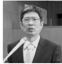
大森 和夫 おおもり かずお 日本共産党