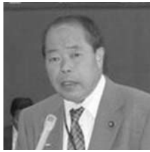
井原 正太郎 いはら しょうたろう 公明党